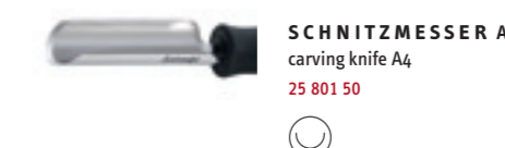
SCHNITZMESSER A4 carving knife A4 25 801 50