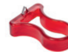
KÜRBIS SCHNITZER "V" pumpkin carver „V“ 50 173 12