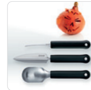
KÜRBIS-SCHNITZ-SET 3-teilig pumpkin carving set, 3-piece 90 835 03 02