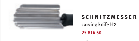
SCHNITZMESSER H2 carving knife H2 25 816 60