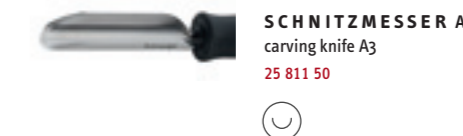
SCHNITZMESSER A3 carving knife A3 25 811 50