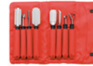
SCHNITZMESSER-SET „Special“ 8-teilig carving tool set „Special“ 8-piece · No. 90 831 08 02