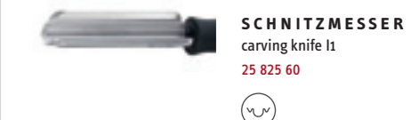
SCHNITZMESSER I1 carving knife I1 25 825 60