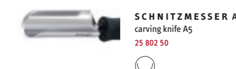
SCHNITZMESSER A5 carving knife A5 25 802 50