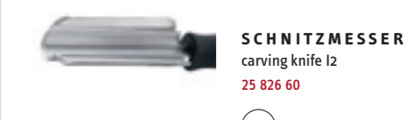
SCHNITZMESSER I2 carving knife I2 25 826 60