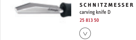
SCHNITZMESSER D carving knife D 25 813 50