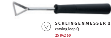
SCHLINGENMESSER Q carving loop Q 25 842 60