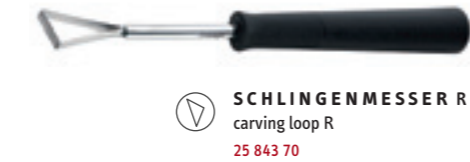
SCHLINGENMESSER R carving loop R 25 843 70