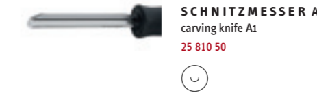
SCHNITZMESSER A1 carving knife A1 25 810 50