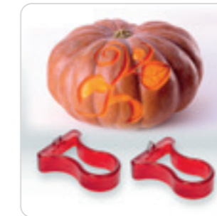
KÜRBIS-SCHNITZER-SET 2-teilig pumpkin carver set, 2-piece 90 176 02 10