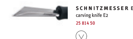
SCHNITZMESSER E2 carving knife E2 25 814 50