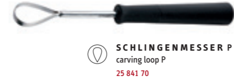
SCHLINGENMESSER P carving loop P 25 841 70