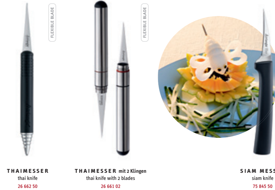
THAIMESSER thai knife 26 662 50