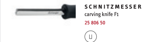
SCHNITZMESSER F1 carving knife F1 25 806 50