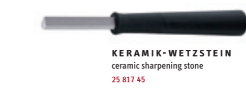
KERAMIK-WETZSTEIN ceramic sharpening stone 25 817 45