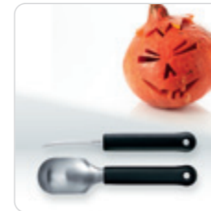
KÜRBIS-SCHNITZ-SET 2-teilig pumpkin carving set, 2-piece 90 185 02 10