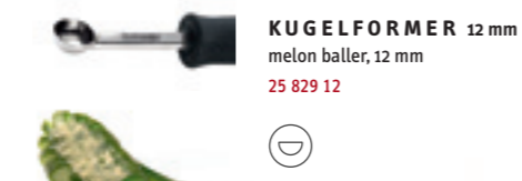
KUGELFORMER 12 mm melon baller, 12 mm 25 829 12