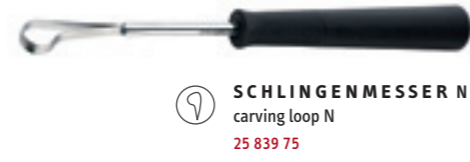
SCHLINGENMESSER N carving loop N 25 839 75