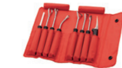
SCHLINGENMESSER-SET 8-teilig loop tool set, 8-piece 90 844 08 02