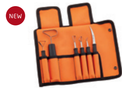
MODELLIERWERKZEUGE T2 sculpting tool T2 25 901 10