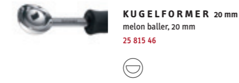
KUGELFORMER 20 mm melon baller, 20 mm 25 815 46