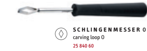
SCHLINGENMESSER O carving loop O 25 840 60