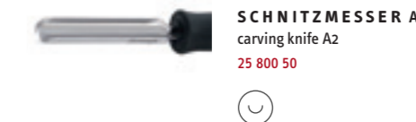
SCHNITZMESSER A2 carving knife A2 25 800 50