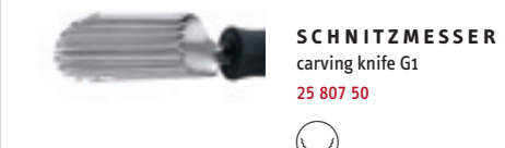
SCHNITZMESSER G1 carving knife G1 25 807 50