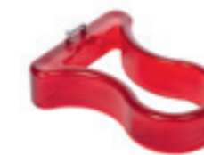
KÜRBIS SCHNITZER "U kurz" pumpkin carver „U short“ 50 174 08