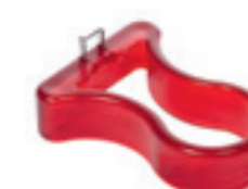
KÜRBIS SCHNITZER "U lang" pumpkin carver „U long“ 50 172 12