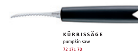
KÜRBISSÄGE pumpkin saw 72 171 70