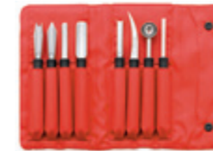
SCHNITZMESSER-SET „Professional“ 8-teilig carving tool set „Professional“ 8-piece · No. 90 818 08 02