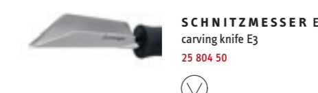
SCHNITZMESSER E3 carving knife E3 25 804 50