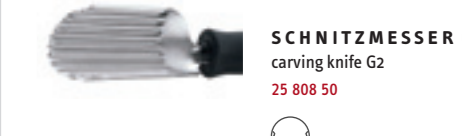
SCHNITZMESSER G2 carving knife G2 25 808 50