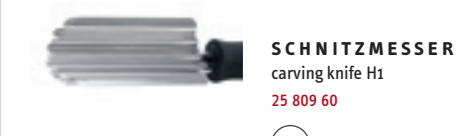
SCHNITZMESSER H1 carving knife H1 25 809 60