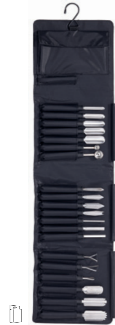
SCHNITZMESSER-SET „Artist“ 20-teilig carving tool set „Artist“, 20-piece 90 858 20 02