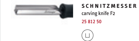
SCHNITZMESSER F2 carving knife F2 25 812 50