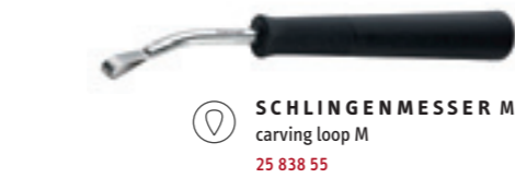
SCHLINGENMESSER M carving loop M 25 838 55