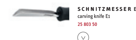
SCHNITZMESSER E1 carving knife E1 25 803 50