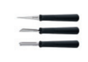
SCHNITZMESSER-SET „Basic“ 3-teilig carving tool set „Basic“ 3-piece · No. 90 857 03 02